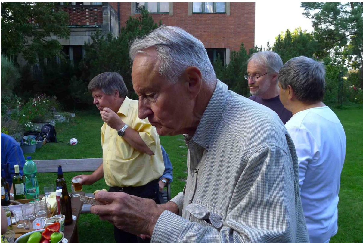
U Petra jsme si nebyli jisti, jestli jí, nebo spí.