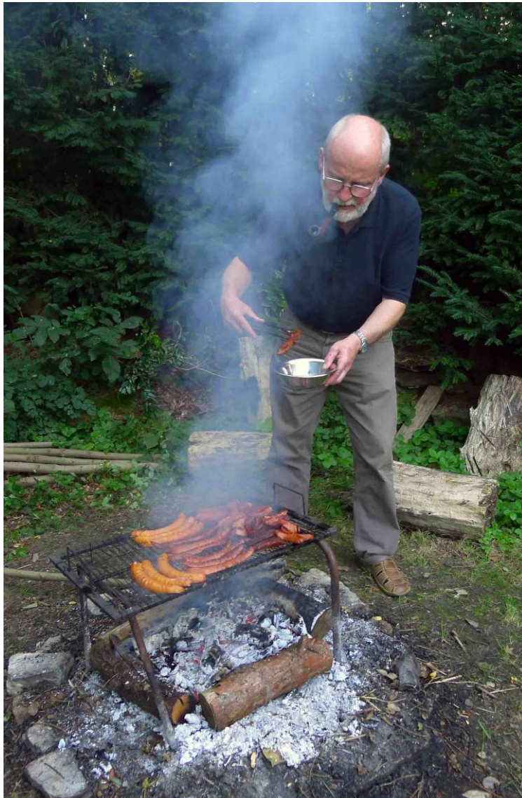
Jako každý rok byli Střeňáci úžasnými hostiteli