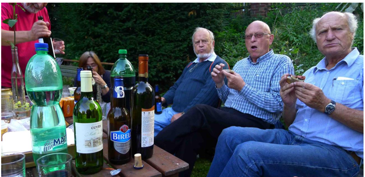
Tři elegantí na snímku naopak dokazují, že my jsme byli jako každý rok úžasnými žravci